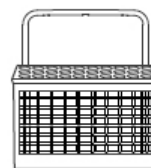
Лоток для столовых приборов