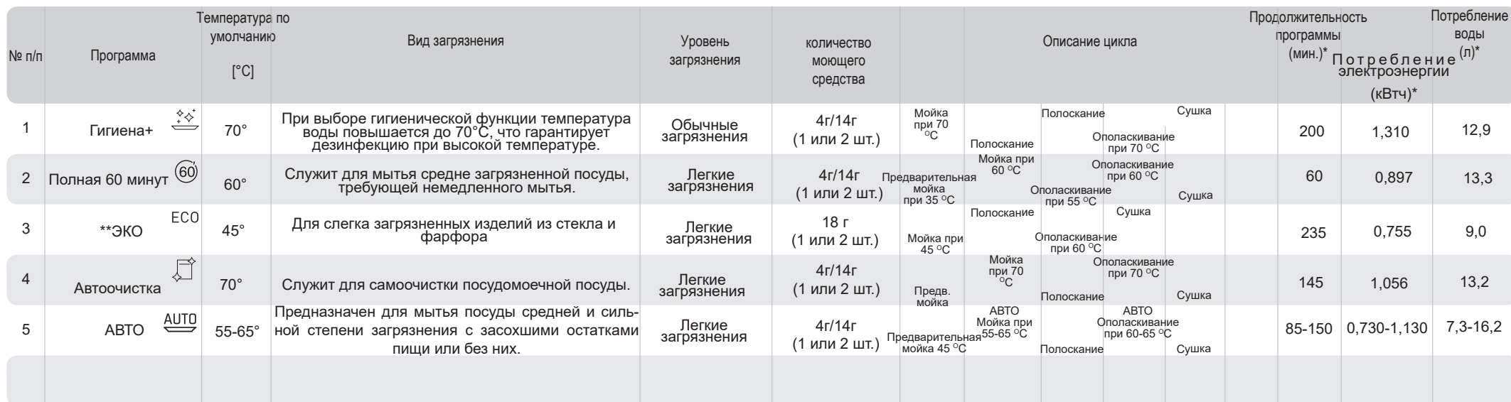
ТАБЛИЦА ПРОГРАММ ПОСУДОМОЕЧНОЙ МАШИНЫ: ZIM435TQ