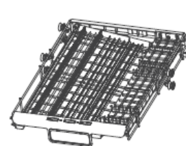
Лоток для столовых приборов