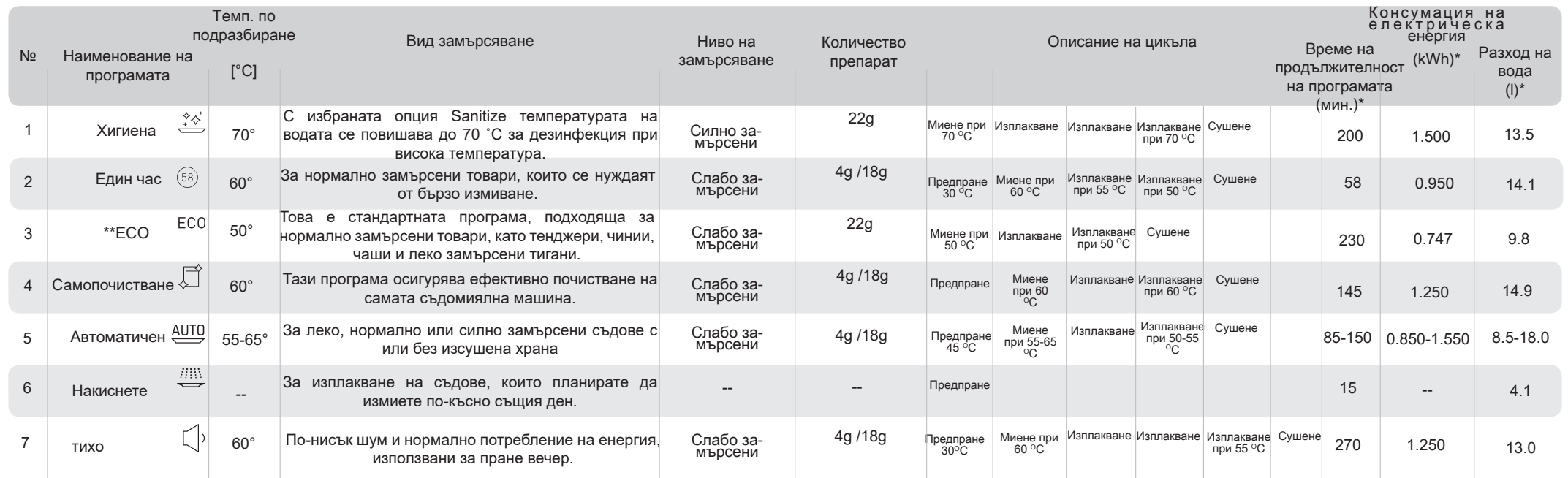
ТАБЛИЦА С ПРОГРАМИ НА СЪДОМИЯЛНАТА: ZIM667ELH

** Стандартна програма. Същевременно това е референтна програма за институциите, провеждащи изпитвания. Изпитване съгласно стандарт EN 60436. Това е програма за миене на нормално замърсена кухненска посуда. Същевременно най-ефективната програма от гледна точка на общото изразходване на енергия и вода за този вид кухненска посуда.