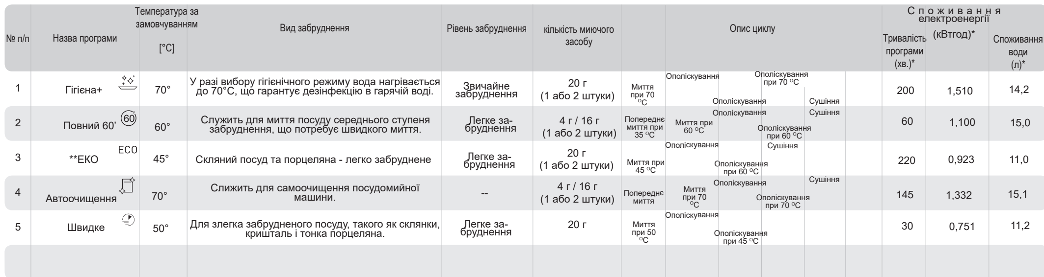
ТАБЛИЦЯ ПРОГРАМ ПОСУДОМИЙНОЇ МАШИНИ: ZIM655H

** Стандартна програма. У той же час це програма посилення для науково-дослідних інститутів. Тестування відповідно до PN-B-02413:60436, Ця програма підходить для миття посуду звичайного рівня забруднення. Це також найбільш ефективна програма з огляду загального споживання енергії та води для даного типу посуду.