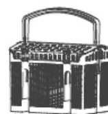
Кошик для столових приборів